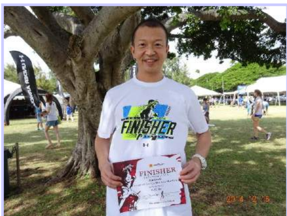
(写真1) 今回のフィニッシャーTシャツは白

今回の第42回ホノルルマラソンは、2014年12月14日に開催されました。ホノルルマラソンの朝はとても早いです。午前2時に起床、午前3時にホテルからスタート地点であるアラモアナ公園に向かい、スタートまで待ちます。午前5時、少し肌寒く小雨の降る中、スタートガンの合図と同時に上がる花火とともにスタートしました。雨の中のホノルルマラソンは初めてでした。過去の2回では、日差しが強く気温は30℃、走るには辛い条件でした。しかし今回は、時おり降る雨と風が寒いくらいで走りやすく、コース上には幾度も虹がかかりました(写真2)。レインボーで有名なハワイからのうれしいプレゼントであり、まさしくこれは『No Rain , No Rainbow (雨が降らなければ、虹もでない)』で、『辛いことの後には、必ず良いことがある』というアロハスピリットです。ホノルルマラソンを走る理由は色々あります。42.195kmのゴールの先に、どんな良いことが待っているのでしょうか。ぜひ走ってそれを感じてもらいたいです。そうすれば、必ずその理由が分かるはずですよ。