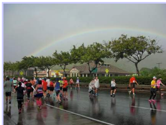
(写真2) ホノルルマラソンのコース上に虹が