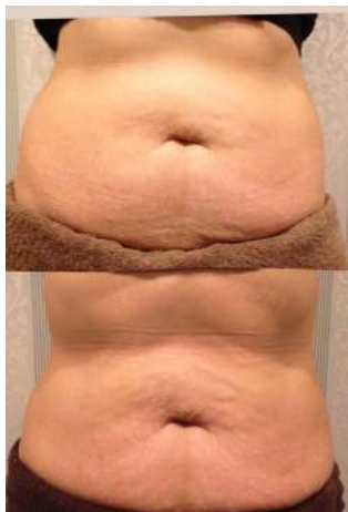
脂肪冷却 1回施術後